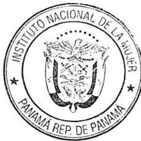
NELLYS HERRERA JIMENEZ DIRECTORA GENERAL a.i. INSTITUTO NACIONAL DE LA MUJER