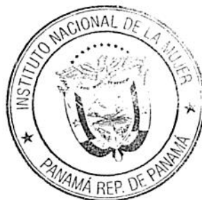
NELLYS HERRERA JIMENEZ DIRECTORA GENERAL a.i. INSTITUTO NACIONAL DE LA MUJER