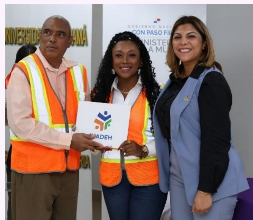
Foto 4: Entrega de certificados por parte del INADEH a participante de curso.