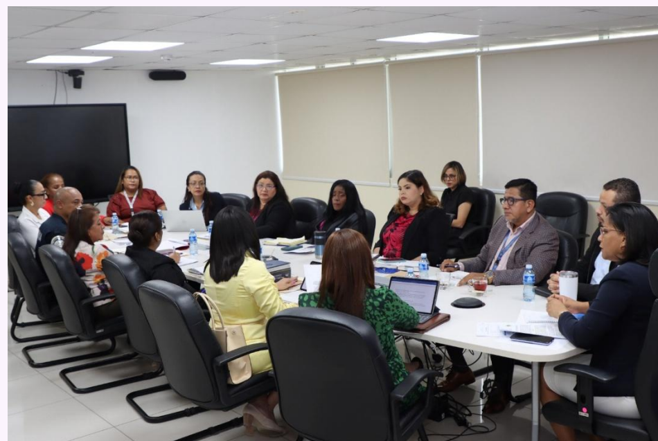
Foto 12: Refuerzo interinstitucional en los casos de delitos de violencia doméstica y de género, con el Ministerio Público y el Instituto de Medicina Legal y Ciencias Forenses.