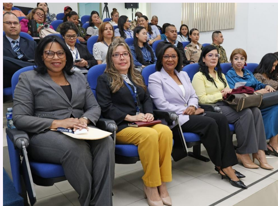
Foto 10: Conversatorio sobre “Acceso y ejercicio continuo de la función pública en condiciones de igualdad, como no discriminación. Experiencias transformadoras en Instituciones Nacionales”, Procuraduría de la Administración.