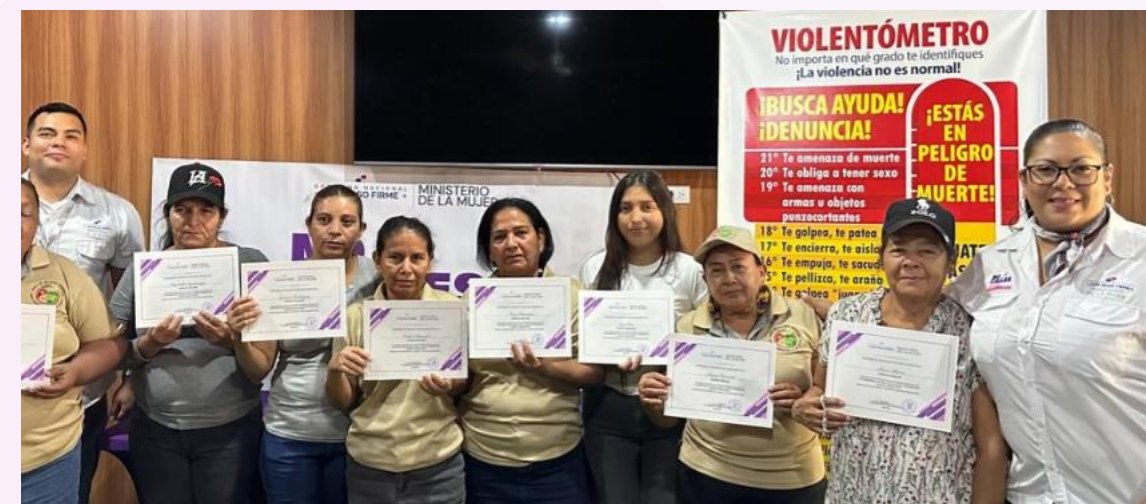
Foto 5: Entrega de certificados de culminación de curso de gastronomía artesanal, Chiriquí.