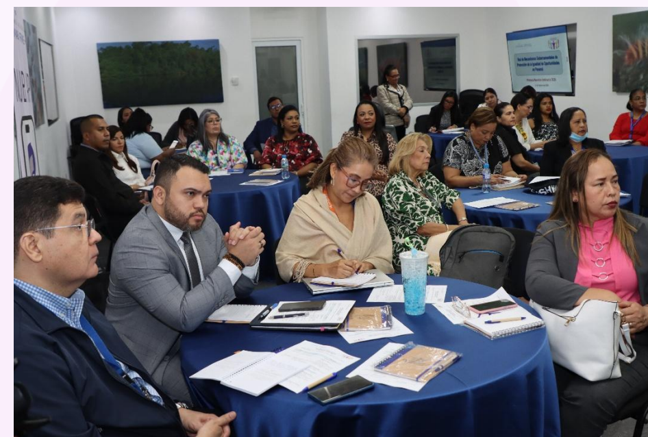
Foto 14 y 15: Reunión Red de Mecanismo Gubernamental de la Mujer en SENACYT.